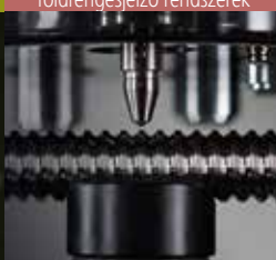
Vizsgáló berendezések és földrengésjelző rendszerek