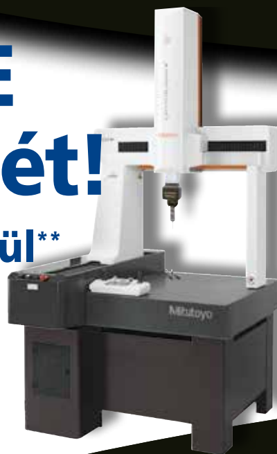
CRYSTA-Apex V 544

Mérési tartomány x: 500 mm y: 400 mm z: 400 mm