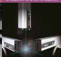
Digital Scale útmérő rendszerek és DRO rendszerek